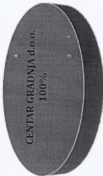
Vlasnička struktura prije i nakon mjera restrukturiranja